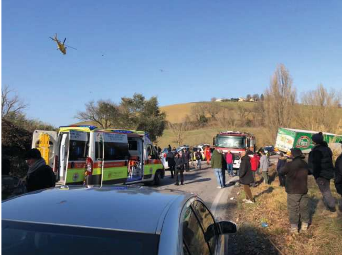
L'incidente di ieri a Cingoli